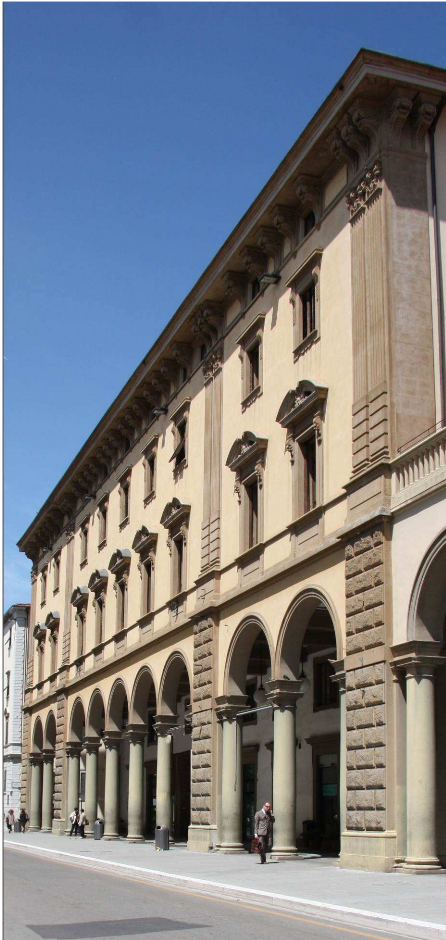
Sede Confindustria Arezzo - Via Roma, 2